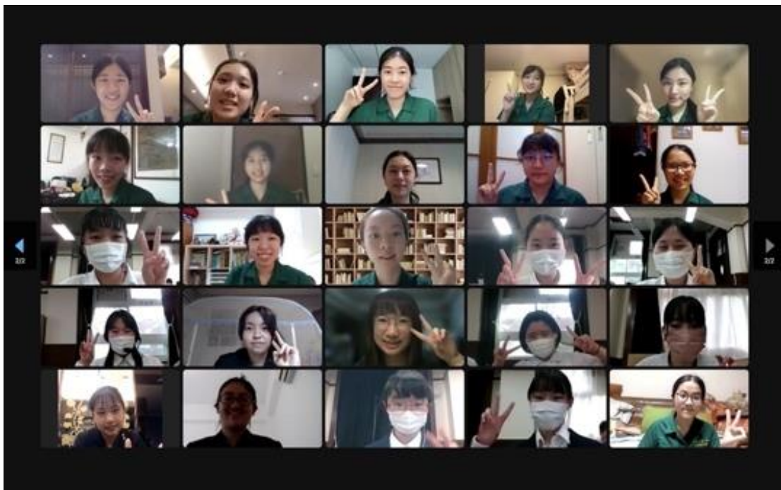
▲ 圖 2 雙方學生大合影 II